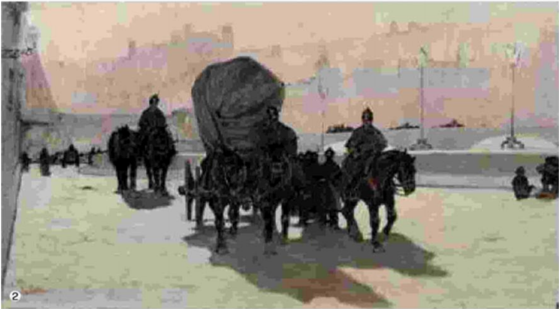
1. Guglielmo Ciardi, «Laguna». 2. Giovanni Fattori «Artiglieri sul Lungarno». La mostra «Ottocento in collezione», inaugurata il 19 ottobre, resterà aperta fino al 24 febbraio