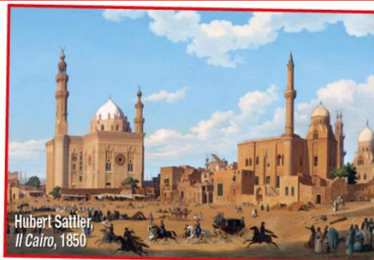
Hubert Sattler, Il Cairo, 1850

approfondire le trasformazioni della tecnica divisionista utilizzata da Morbelli, in parallelo con lo sviluppo dell'interesse per il tema del lavoro femminile, in particolare di quello svolto nelle risaie. Per info: www.museoborgogna.it - www.metsarte.com Fino al 16 settembre, il Castello di San Giorgio a Mantova ospita la mostra Il giro del mondo in 8 stanze che presenta, per la prima volta in Italia, i cosmorami (illusioni ottiche che consentono di vedere quadri panoramici ingranditi