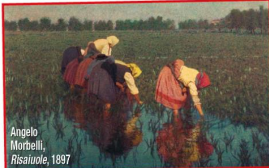
Angelo Morbelli, Risaiuole , 1897

1899, quando fu acquistata dalla Società per le Belle Arti ed Esposizione Permanente di Milano e affidata a uno dei suoi associati per sorteggio, entrando così in collezione privata e rimanendovi fino a oggi. L'esposizione del dipinto rappresenta un'occasione particolarmente significativa per arricchire la conoscenza dell'artista alessandrino e per