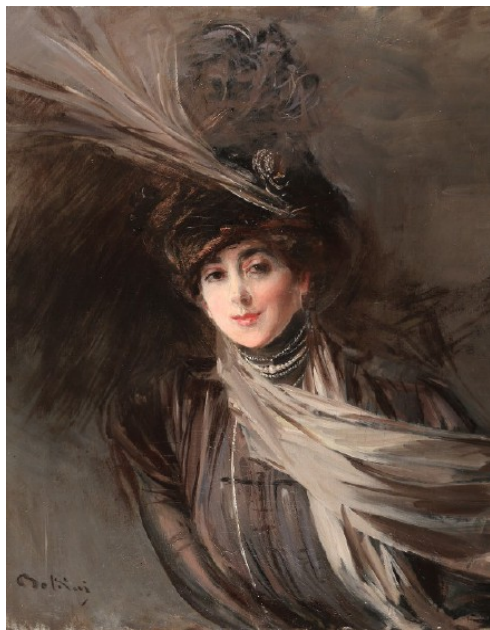
NEL PERCORSO Giovanni Boldini, "Ritratto della signora Errazuriz", olio su tela, 92 x 72cm, e Giuseppe De Nittis, "Westminster", olio su tela, 110 x 195 cm

«Saranno "Boldini, De Nittis et les Italiens de Paris" ad accompagnarci nel nuovo percorso espositivo che offriremo dall'autunno prossimo». Paolo Tacchini, presidente di METS Percorsi d'arte, svela il titolo della mostra in programma dal 4 novembre 2023 al 7 aprile 2024, sempre negli spazi del Castello di Novara. Dove fino al 10 aprile le sale accolgono "Milano. Da romantica a scapigliata", rassegna promossa e prodotta da Comune di Novara, Fondazione Castello e METS Percorsi d'arte. «Abbiamo approfittato della mostra in corso – ancora Tacchini – per annunciare la successiva che prosegue il percorso di approfondimento sulla pittura dell'Ottocento. Sarà dedicata a un tema rilevante per l'arte di quel periodo, tema che affronteremo con un taglio originale e offrendo qualcosa di nuovo. Non una mostra monografica su Boldini che sarà uno dei protagonisti assoluti dell'evento insieme a De Nittis, Mancini e Zandomenighi. Molte opere proverranno da collezioni private e i quadri saranno sempre di altissima qualità. Una nostra caratteristica così come la selezione rigorosa delle opere e la massima attenzione al percorso della mostra. Non sarà una esposizione di quadri fine a se stessa ma, come ha dimostrato anche quella dedicata a Milano, vogliamo offrire un racconto sempre particolarmente originale.