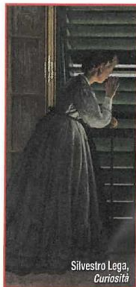
Silvestro Lega, Curiosità